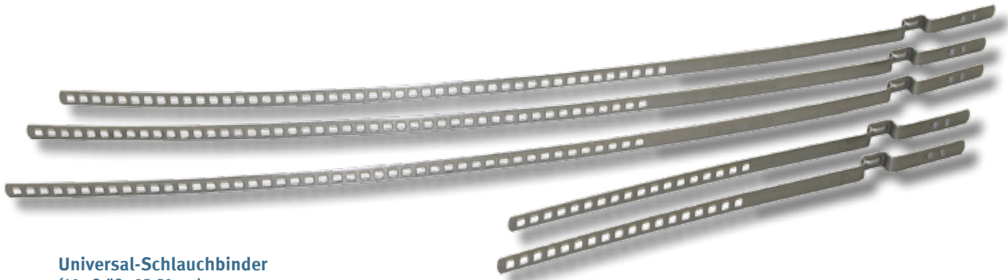
Universal-Schlauchbinder (10x Größe 25-50 und 10x Größe 40-110 im Set) Art. Nr. 24667