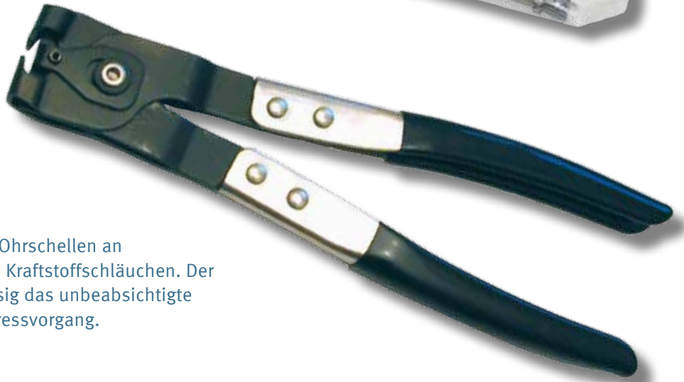
Montagewerkzeug Art. Nr. 190135

Ideal zum Zusammenziehen der Ohrschellen an Gelenkmanschetten, Kühler- und Kraftstoffschläuchen. Der Niederhalter verhindert zuverlässig das unbeabsichtigte Öffnen der Schellen nach dem Pressvorgang.