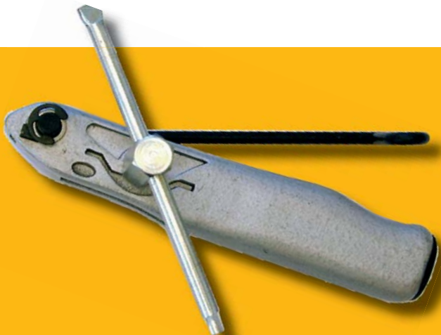
Utensile di montaggio Art. No. 190133