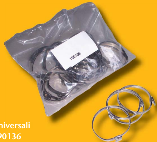
Fascette universali Art. No. 190136