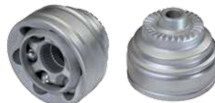
Articulation avec une denture frontale (Face spline)