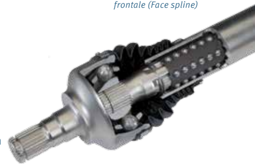
Unité de joint homocinétique avec la technologie Ballspline