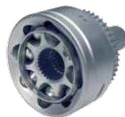
Articulation fixe SX avec la technologie Countertrack™